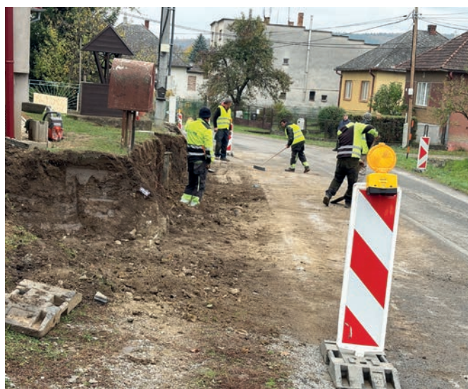
• Výstavba nového chodníka