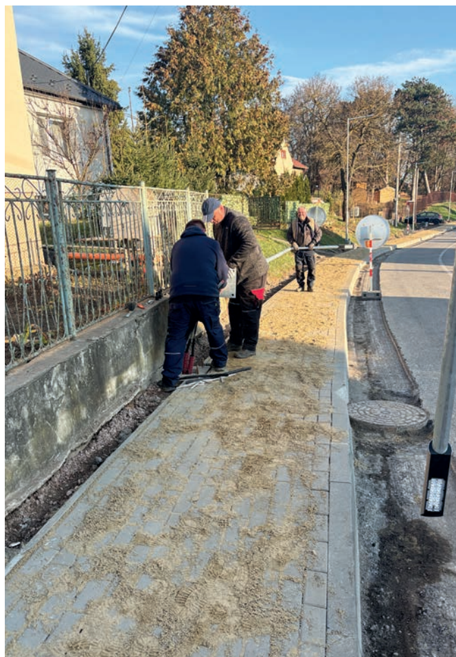
• Inštalácia nového verejného osvetlenia