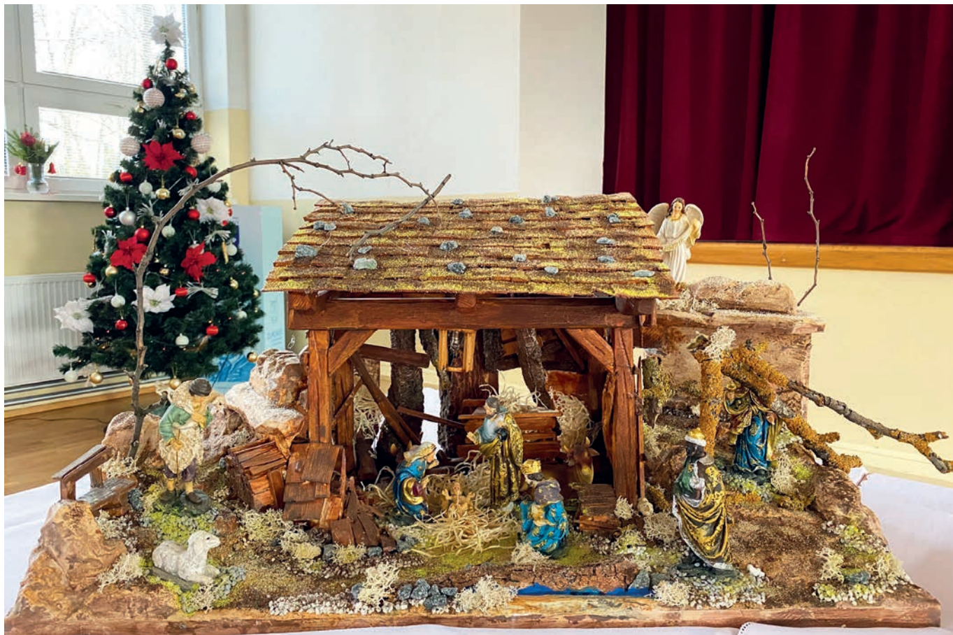
• Betlehem vytvorený Friedrichom Münzkerom zo Združenia priateľov betlehemov v Rakúsku.