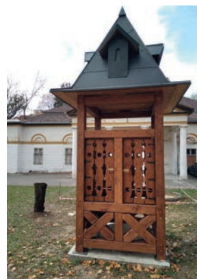
• Studňa – priebeh výstavby