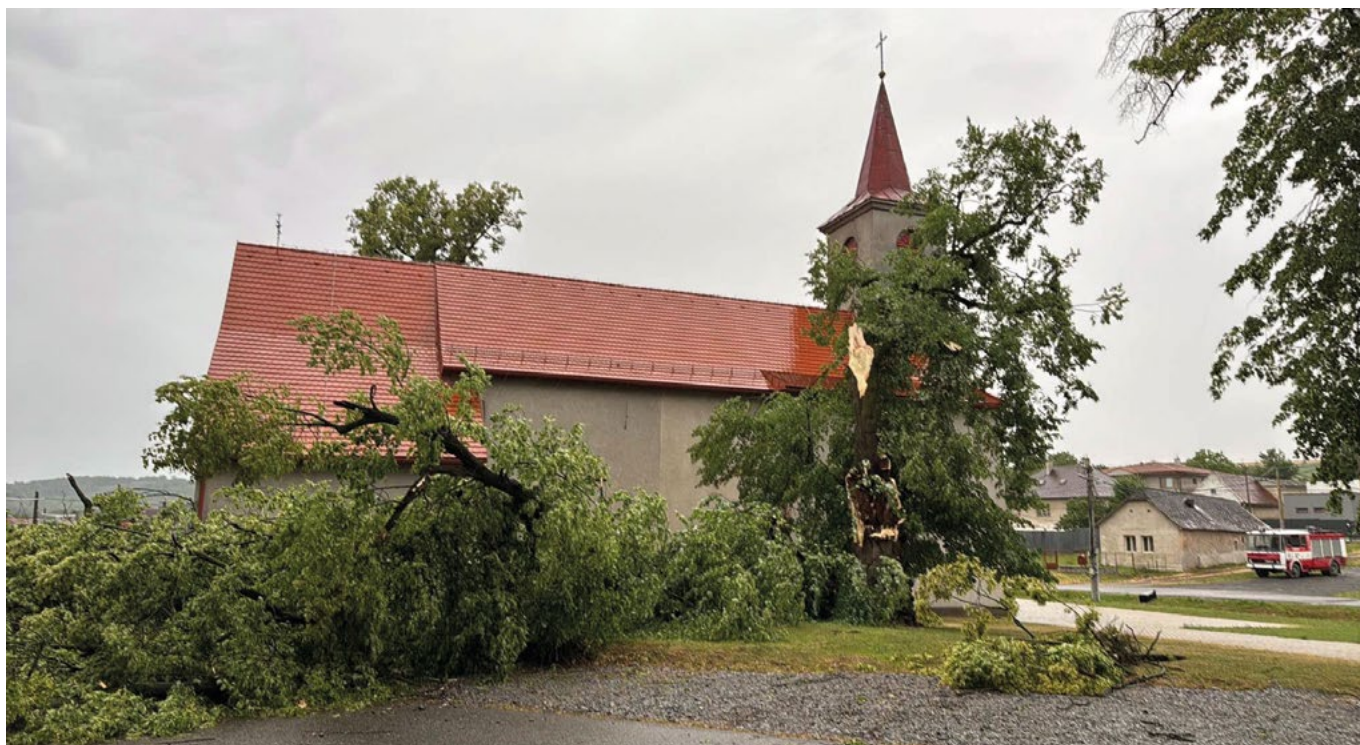
• Stará lipa zničená víchricou