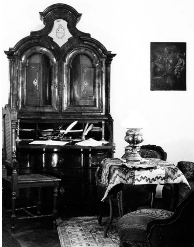
• Pracovňa spisovateľa Záborského

s poprednými predstaviteľmi slovenského, českého a ukrajinského (rusínskeho) kultúrneho života. Osobitnú pozornosť venovali tvorcovia inštalácii dobovej izby, v ktorej bola vystavená časť osobnej Záborského knižnice, a súčasne bola koncipovaná ako spisovateľova pracovňa.