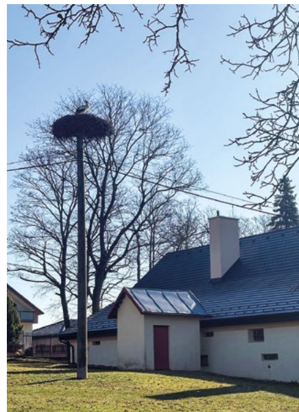
• Župčiansky symbol jari – bocian pri škole