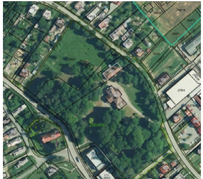
• Parcely obecného parku

Stáva sa, že občan zmení trvalý pobyt alebo meno. Automaticky sa to zmení aj na liste vlastníctva? Alebo je potrebné o to kataster požiadať?