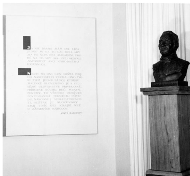
• Pohľad do pamätnej izby

Expozícii pamätnej izby dominovala busta Jonáša Záborského od národného umelca Fraňa Štefunku. V hlavnej miestnosti sa nachádzala Kralická Biblia Záborských, v ktorej Jonáš (a predtým jeho otec) uviedol základné údaje o svojich príbuzných. Ďalšie exponáty dokumentovali Záborského život a pôsobenie najmä v Župčanoch. Išlo o predmety rodinného, školského či literárneho charakteru. Exponáty v expozícii reflektovali všetky významné Záborského pôsobiská, ukážky z jeho rozsiahlej literárnej tvorby či členstvá a zapojenie sa tohto kňaza a historika do príspevkov v jednotlivých časopisoch, inštitúciách a pod. Nepochybne zaujímavou bola mapka dokumentujúca životnú cestu Jonáša Záborského svetom. Na osobitnom paneli boli uvedené kontakty a vyobrazenia Záborského