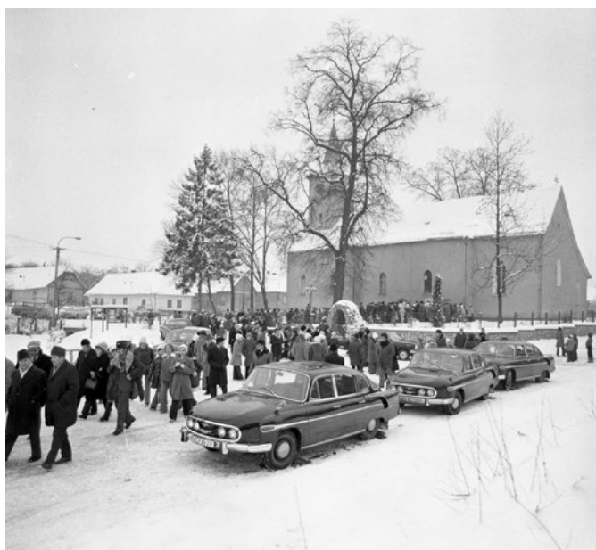
• Z otvorenia expozície, 1976

Pamätnú izbu sa aj napriek značným snahám, množstvu prípravných prác a sústred'ovaniu