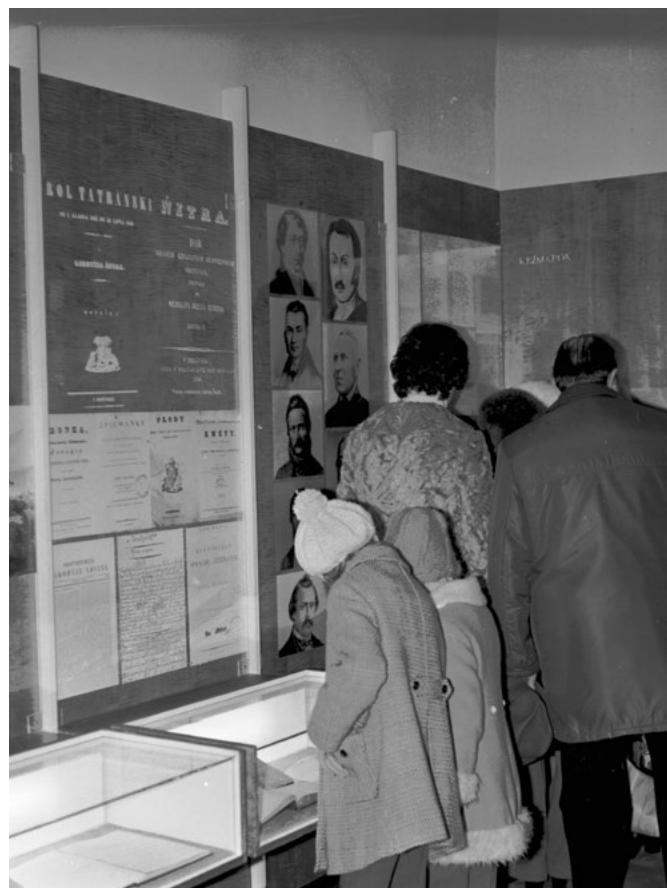
• Záber z expozície v Župčanoch

Výsledná podoba „múzea v Župčanoch“ predstavovala východoslovenské literárne tradície zaradené do celonárodných literárnych úsilí Slovákov, avšak s dô-