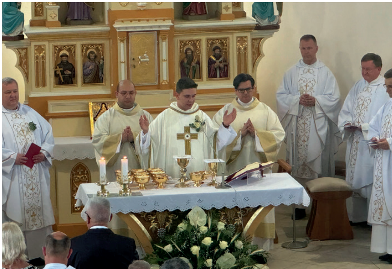
• Primičná svätá omša v Malom Šariši 22. 6. 2024