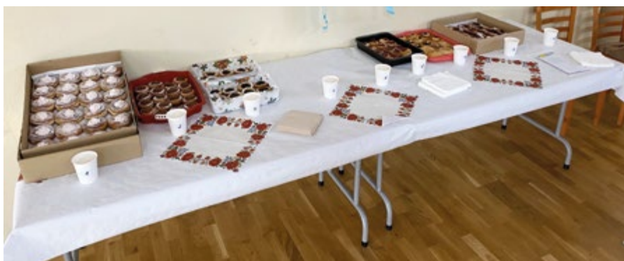
• Šišky, ktoré do súťaže ponúkli župčianske gazdinky